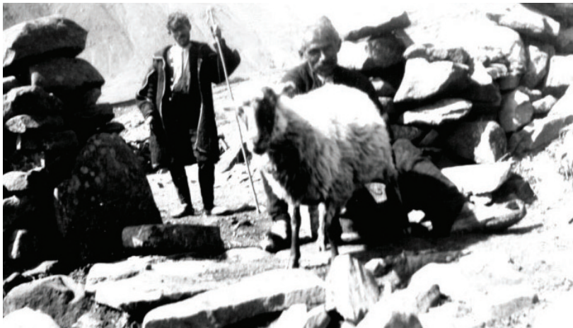
Αρτοτινοί τσοπάνηδες στο άρμεγμα

Παλιότερα σχεδόν οι μισές Αρτοτινές οικογένειες ήταν ποιμνικές και όσοι είχαν μικρά κοπάδια ξεχειμώνιαζαν στα χαμηλώματα κοντά στο χωριό, εκείνοι όμως που είχαν μεγαλύτερα... μόλις έτσουζαν τα πρώτα κρύα του φθινοπώρου, σαν τα αποδημητικά πουλιά, με τα ζωντανά τους – πρόβατα, γίδια, μουλάρια, σκυλιά – κατέβαιναν απ' τα υψώματα στις πλαγιές του βουνού για να ετοιμαστούν για τα χειμαδιά. Κύριος προορισμός τους ήταν η περιοχή Μεσολογγίου, που το κλίμα ναι μεν ήταν υγρό, όμως ο χειμώνας ήταν ήπιος και υποφερτός.