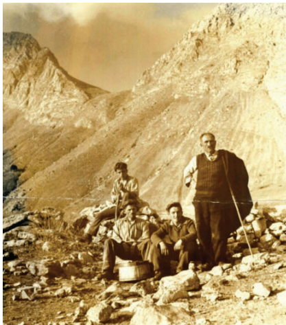
Αρτοτινοί τσοπάνηδες στα Βαρδούσια

Η βλαχοζωή ήταν σκληρή εκείνα τα χρόνια, γι' αυτό ο γύφτος της παροιμίας προτιμούσε τα πέντε κάρβουνα παρά τα χίλια πρόβατα.